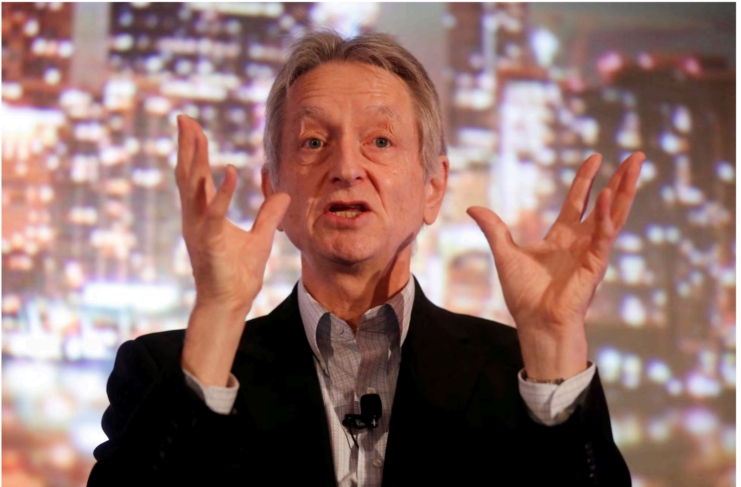
Pionero de la inteligencia artificial, Geoffrey Hinton ha recibido su Nobel cuando dedica más tiempo a alertar sobre los peligros de la IA que a su desarrollo. En la imagen, durante una conferencia en la Thomson Reuters Financial and Risk Summit celebrada en Toronto, Canadá, en diciembre de 2017.

Una de estas redes lleva el nombre de Hopfield, su creador. La red Hopfield usa la parte de la física que describe las características de un material debido a su espín , una propiedad que convierte a cada átomo en un pequeño imán. La red en su conjunto equivaldría a la energía en el sistema de espín encontrado en la física. Su entrenamiento se basa en encontrar valores para las conexiones entre los distintos nodos, de modo que las imágenes guardadas tengan baja energía. Cuando el sistema recibe una imagen distorsionada o incompleta, trabaja metódicamente a través de los nodos, actualiza sus valores. De este modo, la red trabaja paso a paso para encontrar la imagen guardada que se parezca más a la imagen imperfecta con la que se la alimentó.